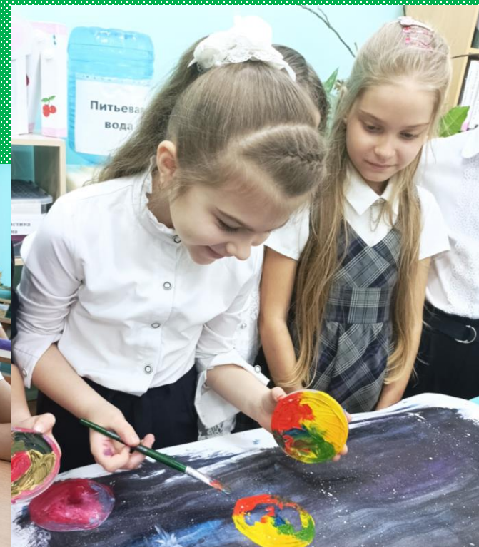
«Каждому своя планета»