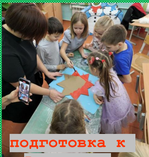
подготовка к Рождеству

ПОЗВОЛЯЕТ ВЫРАЗИТЬ ЭМОЦИИ, УКРЕПЛЯЕТ ВЗАИМООТНОШЕНИЯ В КОЛЛЕКТИВЕ, ПОВЫШАЕТ ХУДОЖЕСТВЕННУЮ КОМПЕТЕНЦИЮ