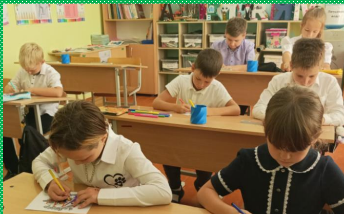
«Моё необычное животное»