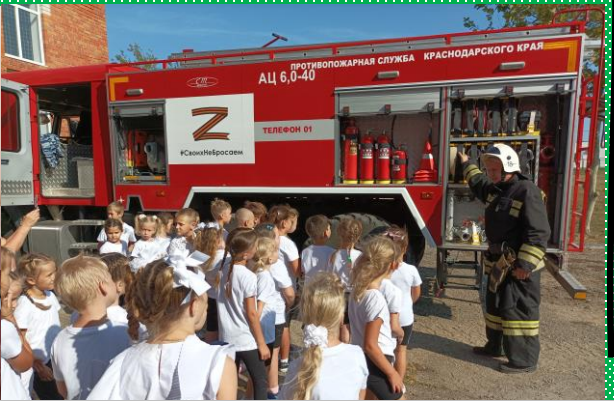
Наши гости, пожарные!

РАЗВИВАЮТ ЛИЧНОСТНЫЕ КАЧЕСТВА, ПОЗВОЛЯЮТ ПРОВЕСТИ ВРЕМЯ С ПОЛЬЗОЙ ДЛЯ ЗДОРОВЬЯ, ПРОЯВИТЬ ТВОРЧЕСКИЕ И ФИЗИЧЕСКИЕ СПОСОБНОСТИ